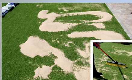
Arena de sílice seca