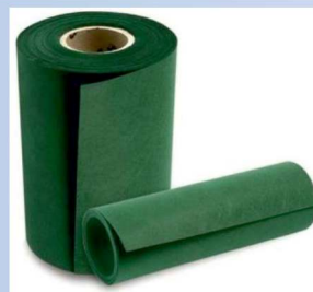
Cinta de unión